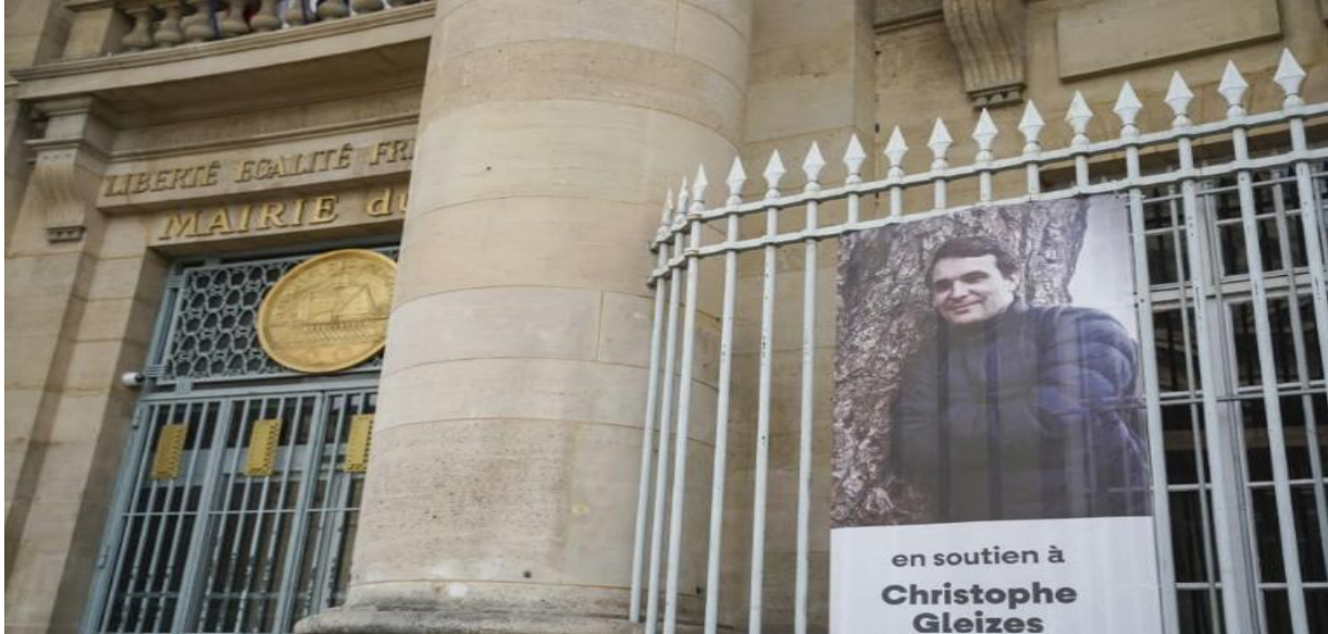
Un portrait de Christophe Gleizes est accroché aux grilles de la mairie du 5e arrondissement de Paris, le 17 avril 2026.

La famille du journaliste, qui s'est rendue en Algérie la semaine du 20 avril pour discuter avec les autorités, annonce aujourd'hui qu'il renonce à se pourvoir en cassation. Ce qui rend possible une grâce prononcée par le président algérien.